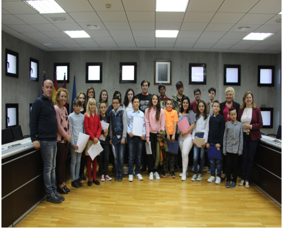
* I PLENO INFANTIL DE SAN PEDRO DEL PINATAR.