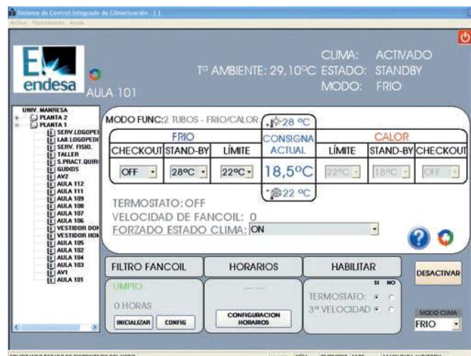
Foto 12. Control zonificado.

Los sistemas de gestión centralizada permiten un control de la temperatura en función de que la sala se encuentre desocupada o sin actividad. De este modo, el sistema permite controlar los parámetros de temperatura y humedad, que son los que influyen en la sensación