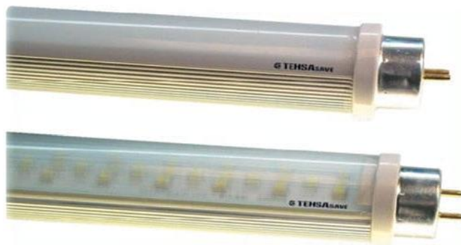
Foto 7. Ejemplos de tubos Led T8 de alta eficiencia con cubierta difusa y rayada.

Una de ellas, si no la más importante, es sin lugar a dudas su bajo consumo ( el equivalente de un tubo de 36 W, con el mismo flujo luminoso, puede obtenerse con un consumo de 18 W y si bien es cierto que hay otras posibilidades entre 15 W a 20 W, dependiendo del fabricante, el consumo está en proporción directa al flujo luminoso ofrecido ), pero no es la única o prioritaria argumentación; su larga vida, la ausencia de calentamiento en su iluminación, su funcionamiento a bajas temperaturas, la ausencia de mercurio en sus componentes, la no emisión de rayos ultravioleta ( UV ), etc. lo adecuan como candidato ideal para un sinnúmero de utilizaciones y sobre todo, para elevados tiempos de utilización ininterrumpida.