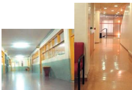
Foto 6 y 7. Iluminación en pasillos de centros escolares.

La iluminación es un apartado que representa aproximadamente el 35% del consumo eléctrico dentro de una instalación del sector, dependiendo este porcentaje de varios factores: tamaño, fachada, aportación de iluminación natural, de la zona donde esté ubicada y del uso que se le dé a cada estancia dentro de la instalación.