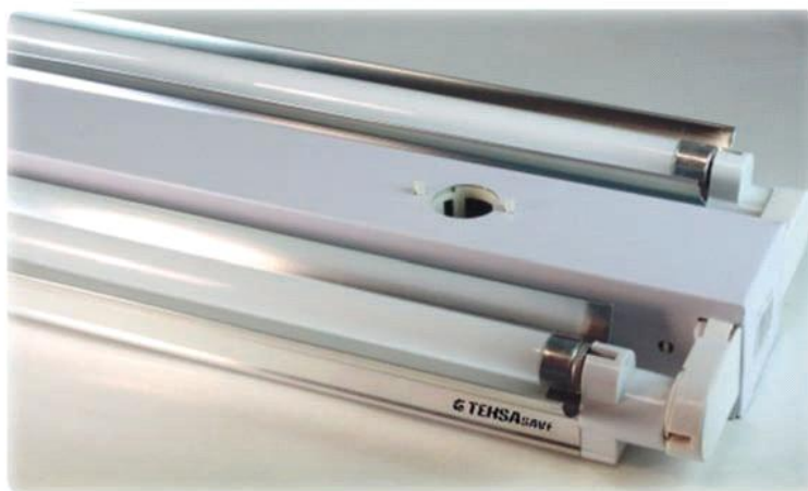
Foto 4. Regletas electrónicas con pantalla T5 montadas sobre la luminaria de referencia.

No es necesario manipular la luminaria, sólo retirar el tubo cebador, que no se necesita, y en todo caso cortar o eliminar el condensador si se desea corregir o mejorar el factor de potencia por encima de PF \geq 0,98 . ( En algunos casos donde un mismo balastro alimenta 2 tubos, es necesario llevar alimentación a los 2 extremos de éstos, es decir, ofrecer 220 V. a los 2 portalámparas de cada tubo ).