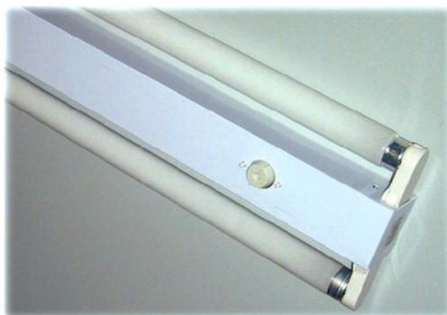
Foto 1. Luminaria nueva utilizada como modelo de referencia para realizar las comparaciones.

Del análisis discrepante con otros técnicos y profesionales, al final se opta por considerar como modelo de referencia, uno de los más predominante en edificaciones de más de cinco años, y el cual está constituido por una luminaria doble, de dos tubos de 36 W., con un par de balastros electromagnéticos EEI=B2 y un condensador de 0,22 \mu\text{f} resultante con un factor de potencia \text{PF}<0,95 , y con un consumo en el laboratorio de 90 W. totales con los tubos fluorescentes que trae de serie.