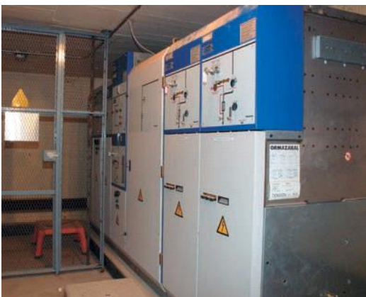
Foto 10. Control de extracción. Foto 11.