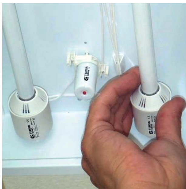
Foto 4. Tubos fluorescentes T5 con adaptadores TEHSAsave electrónicos.

La solución adoptada estaba basada en un adaptador de tecnología «TE- HSAsave» que lo que permite es aprovechar el 100% de la luminaria, actualizando la misma a tubos T5 de alta eficiencia, que junto con el adaptador electrónico, convierten la luminaria en electrónica, generando entre un 35 y un 50% de ahorro en energía ( en función del tamaño de la lámpara ), prolongando la vida de 6.000-8.000 horas a 25.000, eliminando los parpadeos, ruidos y mejorando el factor de potencia de las instalaciones (FPmed>0,95).